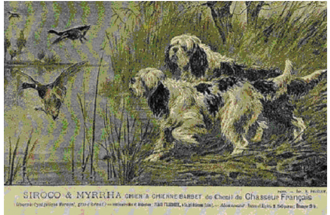
Bild 1. Barbeter i Chasseur Français målning

Barbet är en fransk vattenhund. Namnet Barbet kommer ifrån det franska ordet barbe (skägg). Namnet fick rasen av kynolog Fouilloux som levde på 1500-talet.