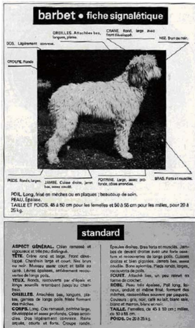
Bild 10. Barbet i en fransk hundbok från 1970-talet

Barbetstammen kan man fortsättningsvis se inflytandet av de båda linjerna.