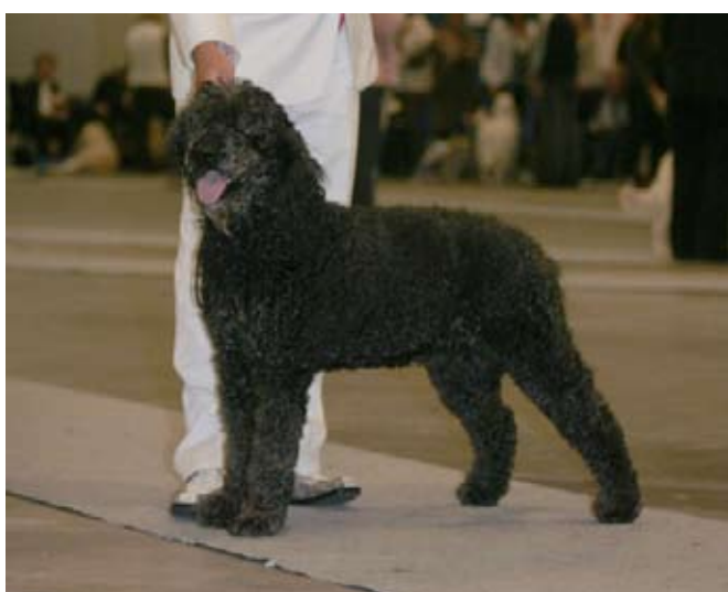
Bild 9. Monsieur Barbet du Pre Leveque (född 1996). Världsvinnare 1998 - 2000 - 2003 (här 11 år 2007)

Fr.o.m. 1980-talet var två olika linjer förhärskande för utvecklandet av rasen. Den ena linjen representerade högvuxna Barbet med krullig päls, som i huvudsak avlats till utställnings- och sällskapshundar.