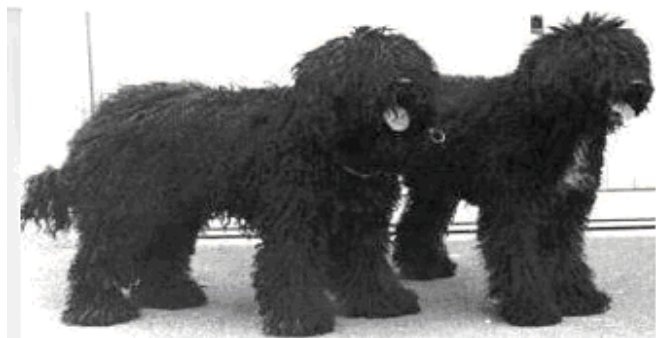
Bild 6. Serynoire T.I. (mamman född 1981) och Ulyssia de Marecages Du Prince (tikvalp född 1983)

Ulyssia användes som förebild, då man ändrade rasbeskrivningen för Barbet 1986. Hermans började söka en hanhund till Ulyssia och hittade en lämplig storpudel, Baron de I'âme du Prince des Horizons. Ur den kombination föddes Esturgeonne des Saute Ruisseaux, som ofta användes i aveln och som R. Milliant köpte. Milliant parade Esturgeonne med storpudeln Blacky under Hermans överinseende under kennelnamnet Canailles de Verbaux.